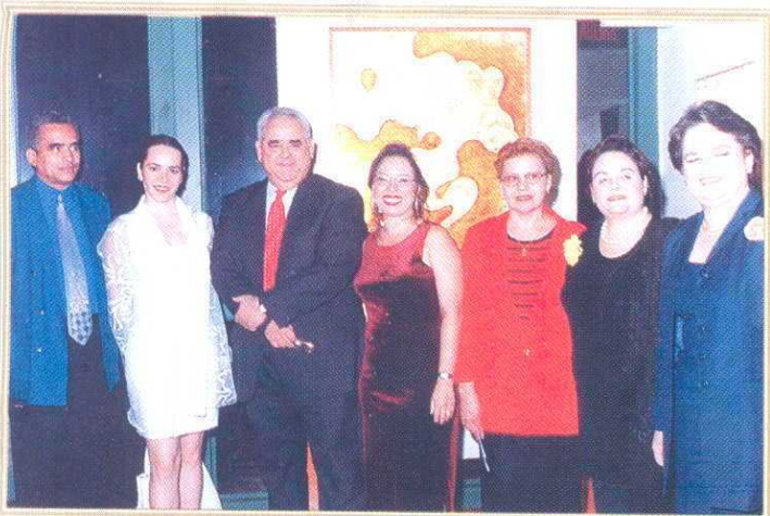
Vista general de los asistentes durante la muestra “Mujeres de Espiritu” en la que participaron artistas de Panamá y de países iberoamericanos, en donde destacó la temática de la sensibilidad femenina.

Entre los objetivos de la muestra esta la recolección de fondos con el fin de implementar una vida mas sana para niños, niñas y adolescentes quienes lastimosamente inician su vida sexual a edad muy temprana y además de forma caótica agravando los riesgos de embarazos prematuros o de enfermedades de transmisión sexual, la parlamentaria señaló que se están iniciando programas de prevención en las provincia de Panamá y Chiriquí y próximamente se dará inicio en otros lugares del país.