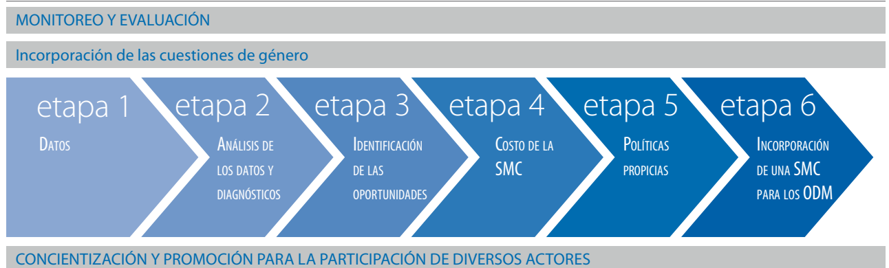
Diagrama 1. Etapas para incorporar la gestión racional de los productos químicos en las estrategias nacionales de desarrollo

enfermedades, la mejoría de la salud humana y del medio ambiente, y el aumento y mantenimiento del estándar de vida en los países de todos los niveles de desarrollo.