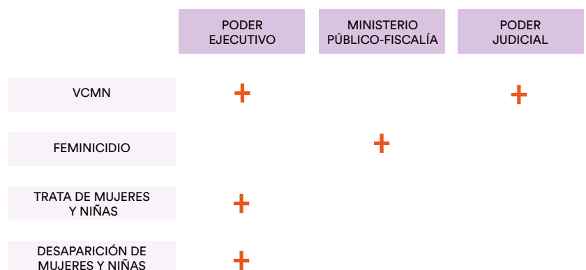
Ilustración 1. Relación de los poderes del Estado en la producción de datos - Honduras

dió ni tampoco sobre trata y desaparición de mujeres y niñas